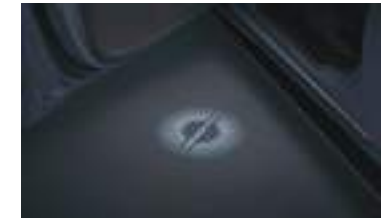
Qapı proyeksiya işığı