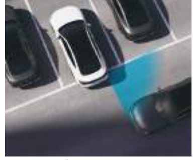
Arxa çarpaz trafik toqquşmasının qarşısının alınması üzrə köməkçi (RCCA)