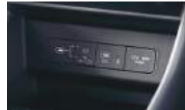
Ön USB çıxışları