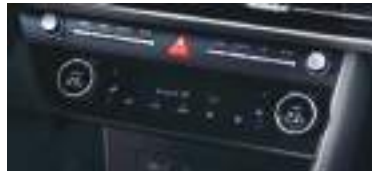
Tam sensor tipli kondisioner kontrol paneli Smartfon simsız şarj cihazı