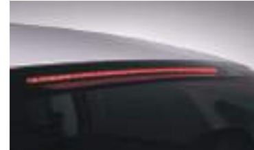
Arxa stop işıqları