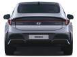
Təkər bazası 1,625 Eni 1,860

Ölçü vahidi : mm * Təkər bazası • 16" yüngül lehimli disk (Ön / Arxa) : 1,633 / 1,640 • 17" yüngül lehimli disk (Ön / Arxa) : 1,623 / 1,630 • 18" yüngül lehimli disk (Ön / Arxa) : 1,610 / 1,617