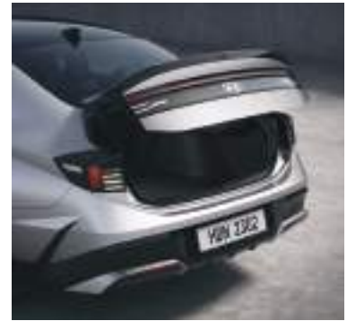
Geniş yük bölümü