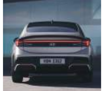
H formalı arxa LED faralar