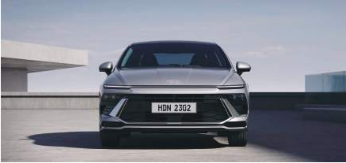
Horizontal LED faralar

Avtomobilin gözoxşayan işıqlandırılmaları və möhkəm lehimli disk dəsti ilə tamamlanan görüntüsü diqqəti cəlb edir.