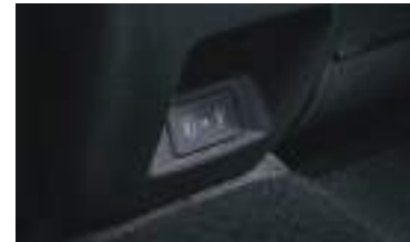
Type-C USB şarj cihazı (2-ci sırada 2li)