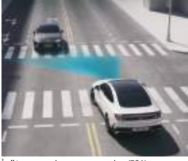
İrəliləyən toqquşmadan yayınma yardımı (FCA)