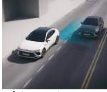
Kor nöqtələr toqquşmasından yayınma yardımı (BCA)