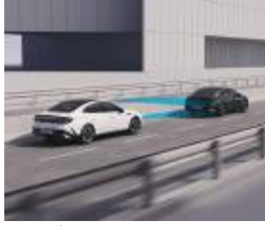
Smart kruiz kontrol (SCC)