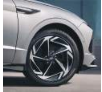
18 düymüklük yüngül lehimli diskler