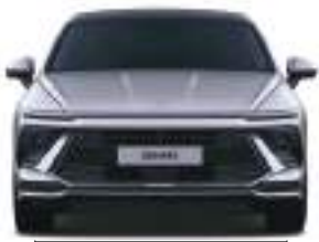
Təkər bazası 1,618 Eni 1,860