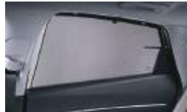
Arxa qapı pərdəsi