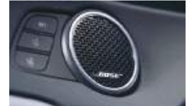
Bose premium səsuçaldan