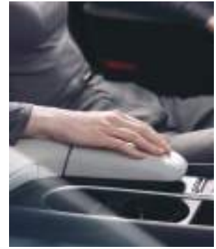
Mərkəzi konsol dayağı