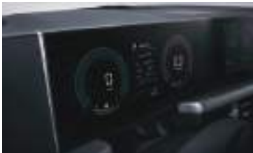
4,2 düymümlük rəngli LCD klaster