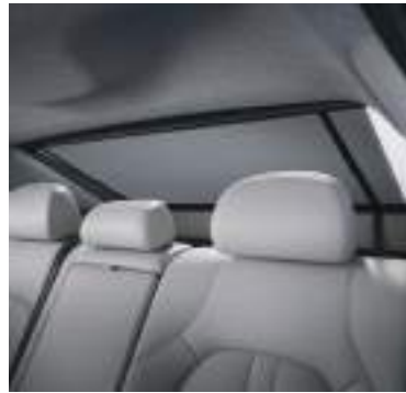
Qatlanan arxa pəncərə pərdəsi