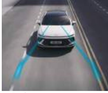
Zolağı təqib yardımı (LFA)