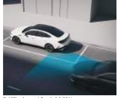
Təhlükəsiz çıxış köməkçisi (SEA)