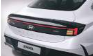
LED arxa kombinasiya faraları (bulb turn)