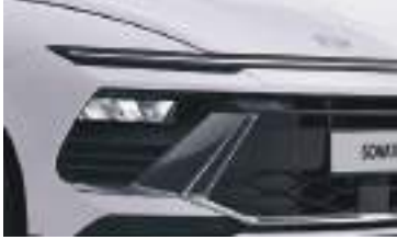
LED ön işıqlar (MFR)