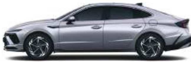
Təkər bazası 2,840 Uzunluq 4,910