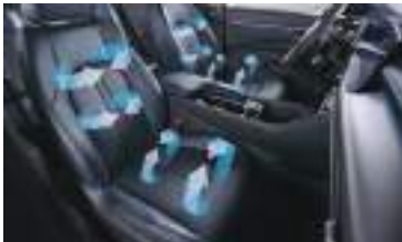
Havalandırılan 1-ci sıra oturmaqalar