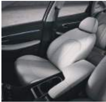
Ultrakomfortlu qabaq səmişin oturacağı