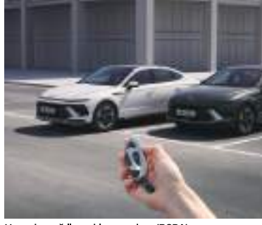
Uzaqdan ağıllı parkinq yardımı (RSPA)