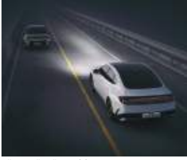
Yüksək şüa köməkçisi (HBA)