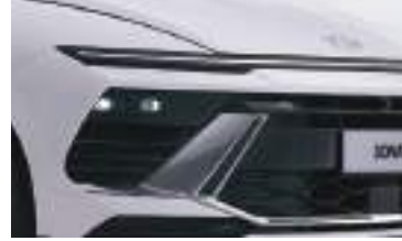
LED ön işıqlar (projection)