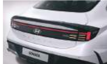
LED arxa kombinasiya faraları (LED turn)