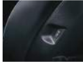
USB şarj portları