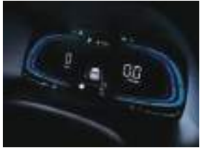
4.2" TFT LCD Supervision klaster