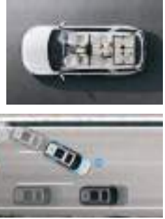
Çoxlu toquşma əyləci (MCB)