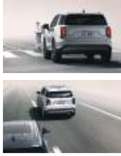
İrəli toquşmadan yayınma sistemi (FCA) Kor nöqtə toquşma xəbərdarlığı (BCW)