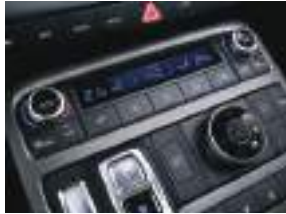
Tam avtomatik kondisioner sistemi