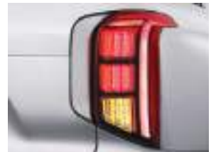
LED arxa kombinasiya işıqları