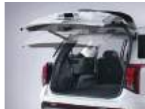
Ağıllı arxa qapı sistemi