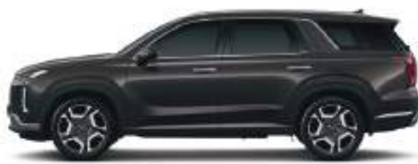
Təkər bazası Uzunluq 2,900 4,995