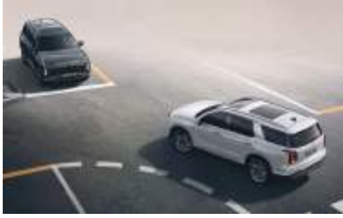
İrəli toquşmadan yayınma sistemi (FCA, Qovşaqda Dönmə) Sürərkən, kəsişmədə sola dönərkən qarşıdan gələn avtomobillə toquşma riski varsa, avtomatik olaraq təcili əyləclə kömək edir.