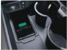
Simsiz smartfon şarj cihazı