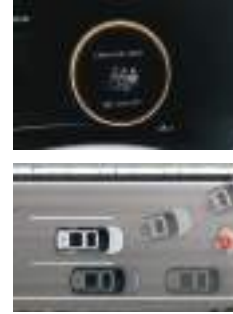
Arxa sərnişin xəbərdarlığı (ROA)