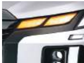
Gizli işıqlandırma dönmə siqnal lampası