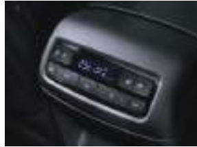
Üç zonaslı, müstəqil sürətəmə, çim avtomatik kondisioner