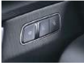
Oturacaq yaddaş paketi