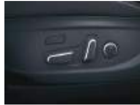
2 tərəfli bel dəstəyi ilə 8 tərəfli elektrikli sürücü oturacağı