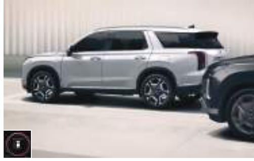
Təhlükəsiz çıxış köməkçisi (SEA)