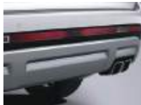
Arxa duman əleyhinə faralar