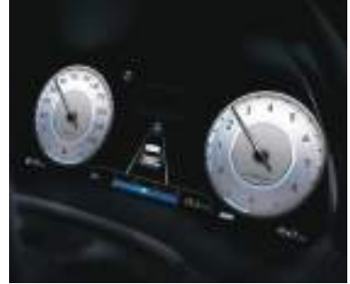
12,3" Tam supervision klaster