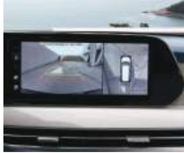
360° Monitor (SVM)