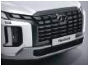
Tünd xrom radiator barmaqlığı