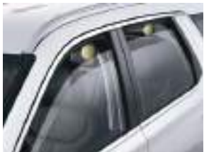
Avtonom təhlükəsizlik üçün elektrikli pəncərələr