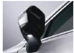
Yan güzgü işıqları