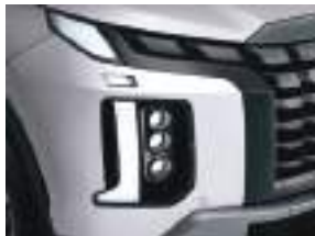
Tam LED faralar