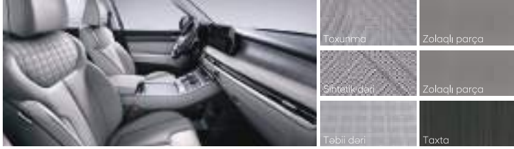
İki rəngli interyer