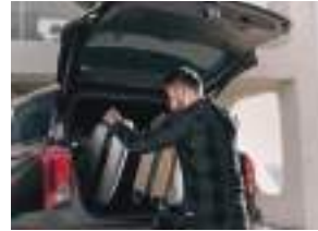
Ağıllı arxa qapı sistemi