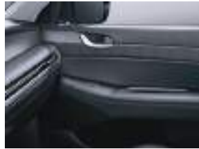
Dəri qapı qoltuqaltı