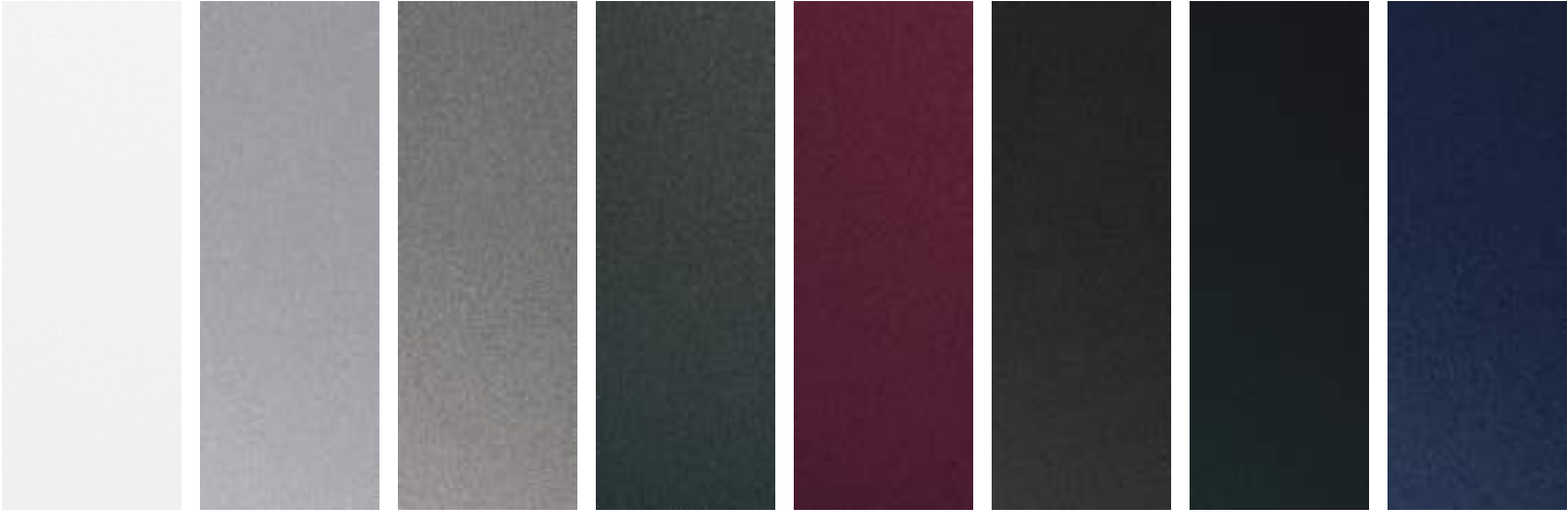
Kremi ağ (WC9_3-coat) Parlaq boz Metallic (R2T) Boz metallik (X5R) Gr Yaş asfalt metallik (P7V) Burgundy (W7B) Qəhvəyi mirvari (D2S) Qara mirvari (A2B) Mavi mirvari (UB7)