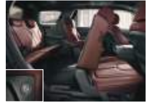
Arxa oturmaqlarının elektrikli qatlanması