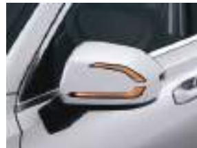
LED xarici güzgü təkrarlayıcıları