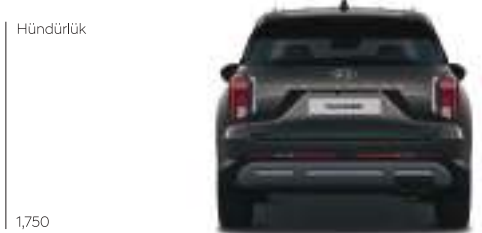
Hündürlük 1,750 Təkər bazası En 1,716 1,975