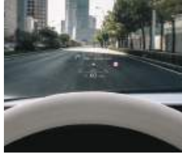
Head-Up display (HUD)