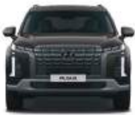
Təkər bazası En 1,708 1,975