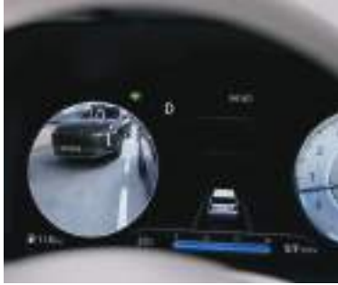
Kor nöqtə nəzarət monitoru (BVM)