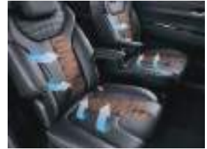
1 və 2-ci sıra oturacaqların isidilməsi və havalandırması